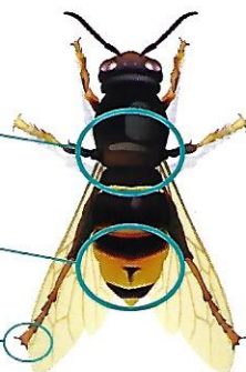
Frelon asiatique (taille réelle 3 cm)