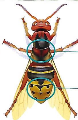
Frelon commun (jusqu'à 4 cm)