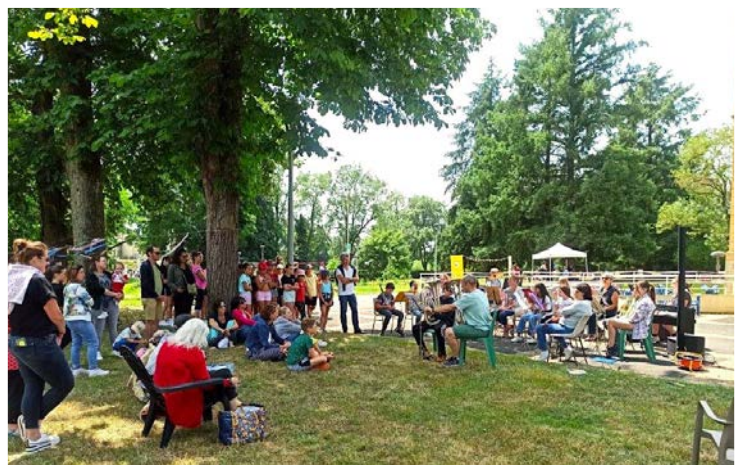
Échappée sous les arbres