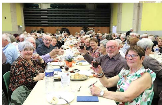
Repas de nos aînés