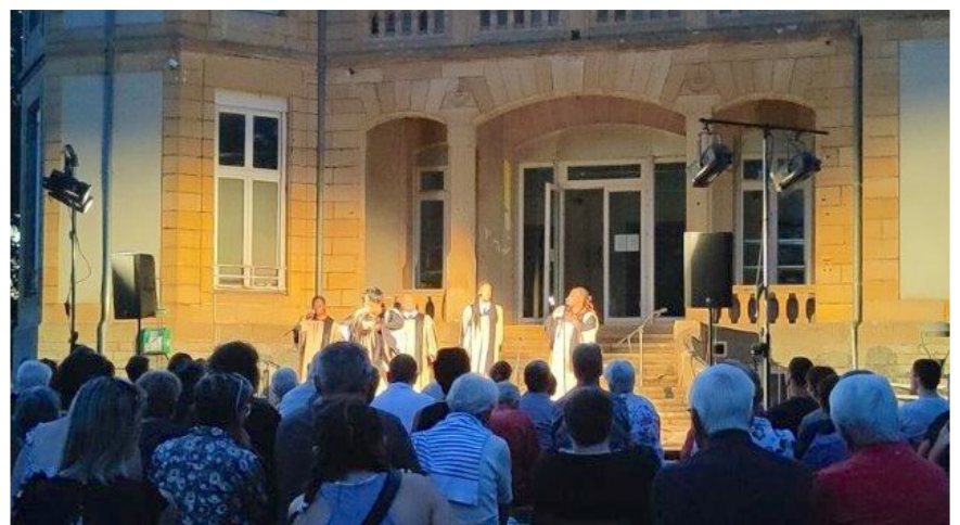
Echappée sous les arbres : soirée Gospel