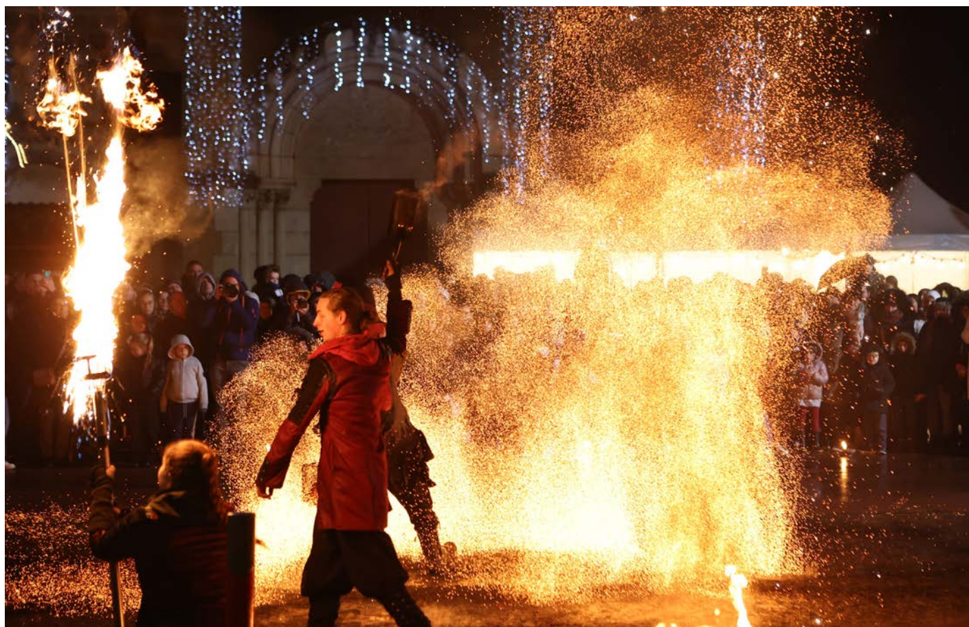
Soirée des Lucioles