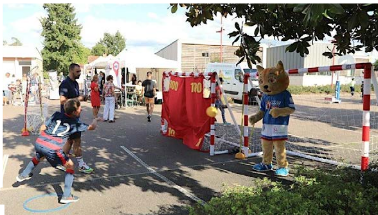
Place aux associations