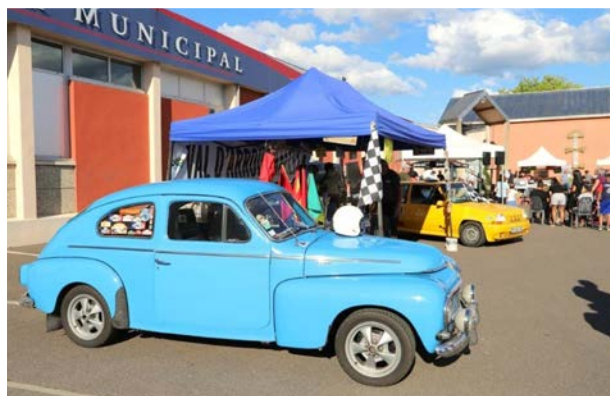
Place aux associations