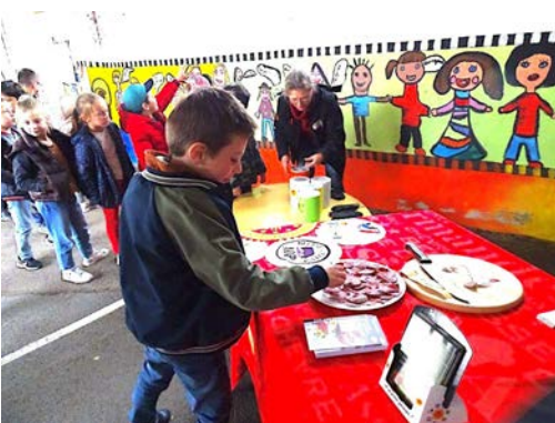
Made in Viande